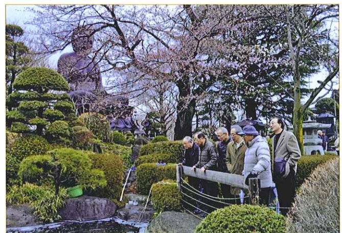
▲境内の池の鯉を眺める