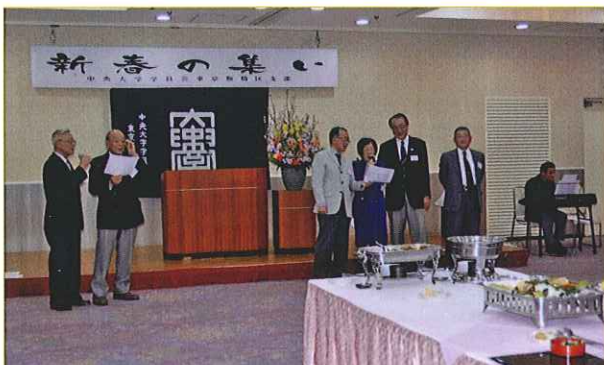
▲本年（平成29年）1月21日の新年会

平成30年度新年会は1月27日(土)に決定！ 板橋区立文化会館4F大会議室で開催します。