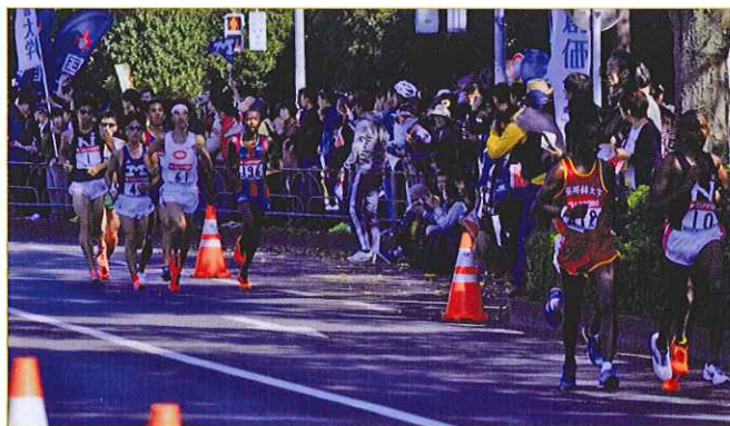
右の写真は昨年度の予選会のもので 本年（2017年）は、10月14日（土） 立川駐屯地9時35分スタートで実施 されます