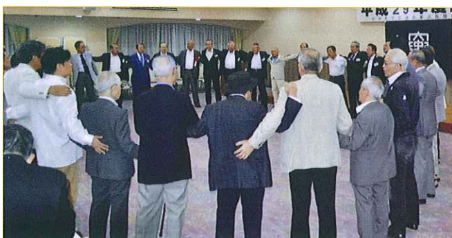
▲再会を期して〈惜別の歌〉を斉唱