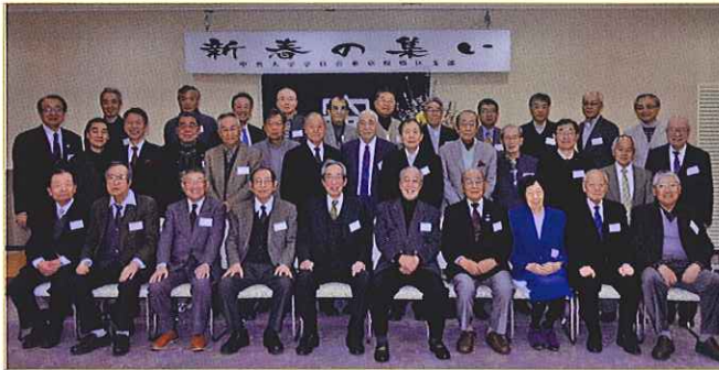
▲新年会の集合写真

支部恒例の新年会は、1月21日（土）午後6時から、区立文化会館において、参加者35人（来客2人・会員33人）のもとに開催されました。