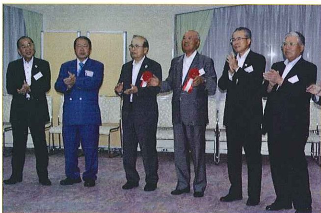
▲全員で応援歌を歌う